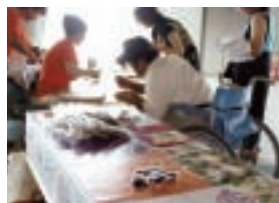
水泳競技 8月18・19日 大阪/なみはやドーム

カリフォルニア・レーズン協会は、2007年度より大会公式サポーターとなりました。パラリンピックとは、「もう一つの(Parallel)+オリンピック(Olympic)」を意味し、ジャパンパラリンピック大会は、(財)日本障害者スポーツ協会日本パラリンピック委員会が競技団体と共催する、障害のある選手のための国内最高峰の競技大会です。1989年に国際パラリンピック委員会(IPC)が設立され、パラリンピックが世界最高峰のエリートスポーツ大会となったことを契機に、日本国内の競技向上と記録の公認を図ることを目標に開催されています。2007年度のジャパンパラリンピック大会は、北京パラリンピック大会の選考大会でもあります。“カリフォルニア・レーズン協会はジャパンパラリンピック大会を応援しています。”