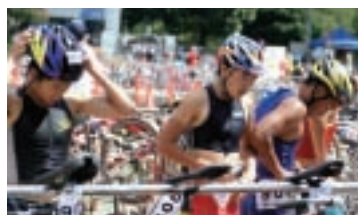
キッズトライアスロン 9月16日 東京・立川/昭和記念公園