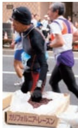
エイドステーションでは大勢のランナーが、カリフォルニア・レーズンを手にしていました。