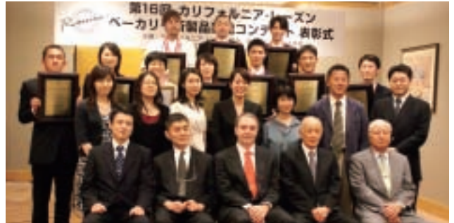
第16回コンテスト各賞受賞者記念撮影

当コンテストは、カリフォルニア・レーズンを使った新製品の開発とその商品化を目的とし、製パンに携わるすべての技術者を対象に、毎年協会が主催。前号でもお伝えしたように、受賞作品からは続々と新商品が誕生しています。17回目となる今年は、「ホールセール・コンビニエンス製品部門」、「インスタ・リテールベーカリー製品部門」と、新たに「規定作品部門」を設け、3つの部門で作品を募集いたします。規定作品部門とは、設けられた規定にそった作品を対象とした部門で、今年は「焼き型を使用した食パン」を規定といたします。チャレンジに胸躍らせるみなさん、今年こそは入賞をと意気込むみなさん。6月20日、最終審査会場でおいししましょう。