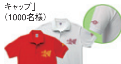
Bコース「オリジナルポロシャツ&キャップ」 (1000名様)