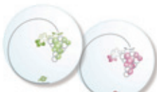
Aコース「オリジナルレイジーズーザンプレート2枚セット」 (2000名様)

協会では、現在、5月1日のカリフォルニア・レーズンデーにあわせ、現在、抽選で5,000名様に、素敵なお礼品が当たる「カリフォルニア・レーズンキャンペーン」を実施中です。賞品は選べる2コース。Aコースは「オリジナルレイジーズーザンプレート2枚セット」、Bコースはダンシングレーズンとホルモー君をあしらった「オリジナルポロシャツ&キャップ」、さらに今年は、「オリジナルダンシング・レーズン&ホルモーストラップ」が当たるWチャンスもご用意。また、Webおよび携帯のキャンペーンサイトでは「鴨川ホルモー」の映画鑑賞割引クーポン券プレゼントも実施中。レーズン&ホルモーパワーで不況風を吹き飛ばし、カリフォルニア・レーズン商品の販売拡大、参加企業の売上増を目指します。