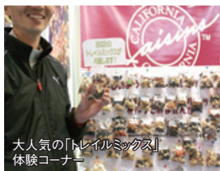
大人気の「トレイルミックス」体験コーナー