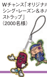
Wチャンス「オリジナルダンシング・レーズン&ホルモーストラップ」 (2000名様)