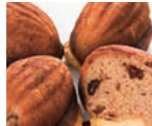
第16回ベーカリーコンテスト 消費者推薦優秀賞 クリームフレームシードレス

耐熱皿にレーズン100g とかぶる程度の水を入れ、電子レンジで1分加熱します。水気を切ったらレーズンをミキサーにかけペーストを作ります。保存期間は冷蔵庫で約2~3週間が目安となります。