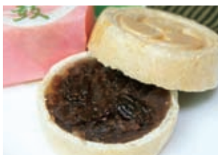
福井県敦賀市神楽町2-6-21(本店) TEL0770-22-0289 10個入1,470円(税込み)

北陸道総鎮守「気比神宮」の神賑行事として奉納された「気比太鼓」にちなんだ商品とのこと。レーズンの酸味が餡の甘さを適度に抑え、食感も生きて、シンプルなお菓子に力強いアクセントを加えている。創業明治23年、北前船で栄えた港町敦賀で「良いものは残し、日々改革の精神で頑張る」という5代目の心意気が伝わってくる。