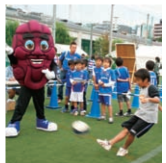
2009年10月、横浜マリノスと協会との共同活動「カリフォルニア・レーズンパーク」で見事なサッカーテクニックを披露する子供達

前日の準備としては「晩ごはんはご飯を多めに」とアドバイスされてはいかがでしょうか。当日の朝食は、試合開始時間を考えながら炭水化物の多い主食を中心に食べられたものを食べる。試合開始までに1~2時間という場合は、おにぎりやパン、果物などを適量食べさせてもかまいません。レーズンを代わりに使うことは十分可能です。マリノスでは30g入り小袋を食堂に置いて利用していますが、小袋入りを用意出来ない場合は、大袋入りを小分けにして利用されると便利でしょう。試合後も早めに炭水化物を補給するためレーズンは有効です。夏場は試合中にもこまめに水分を補給させますが、大量に汗をかく場合は塩分などミネラルを同時に補給することも重要です。その点でもレーズンは有効にお使いいただけだと思います。