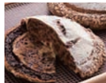
第18回ベーカリーコンテスト特別賞

蒸して白ワインに漬けたレーズンを使いプロセッサで自家製レーズンペーストを作り、レーズンとともに生地にはり込む。フィリングにはクリームチーズをたっぷり使う。