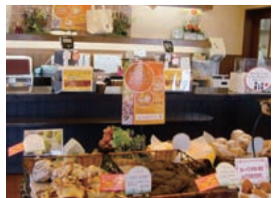
アヴァンセ長久手店では入り口付近にハガキを書ける台を設置し応募箱を置いたところ、「その場で応募できて便利」と多くのお客様にご好評いただきました。

6月15日には抽選会を実施し合計4,000名の当選者を決定いたしました。今年はPCサイトや携帯電話サイトからの応募も可能とし、総数214,081通の応募が集まりました。キャンペーン期間中、参加店舗を対象に「売り場作りコンテスト」を開催し、キャンペーンPOPや独自POPを使い工夫した売り場を作った優秀13店舗を選出し、表彰状と賞品を贈呈しました。また、今年のキャンペーンの応募数に応じた額を、障害者のスポーツ振興支援として「日本障害者スポーツ協会」へ寄付させていただきました。今回のキャンペーンにご協力いただいた全ての皆様に心より感謝申し上げます。来年もよろしくお願ひします。