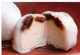
滋賀県甲賀市水口町三大寺34(本社工場) TEL0748-62-2058 8個入1,092円(税込み)※季節商品

大福のバリエーションは皮の餅と中身の餡に何を混ぜるかによって決まる。この商品は白餡にクリームチーズを練り合わせ、シンプルな餅皮でラムレーズンと同時に包み、洋菓子風の食感が特徴。もちもち感の中に、濃厚なレアチーズとラムレーズンの風味が絶妙なハーモニーを醸し出し、チーズとレーズンの相性の良さを改めて確認できる。