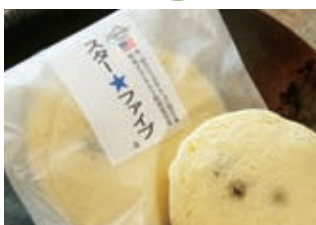
東京都目黒区中町1-37-13(本店) TEL03-3716-2283 1個210円(税込み)

協会コンテスト特別賞受賞以来、お店の看板商品としてロングセラーを続け、今でも進化を続けるレーズンと和菓子のスター的存在。上品な餡の甘さにラムレーズンに加えたシナモンの香りが加わり、繰り返し食べたくなる味。ふっくら焼きあがった生地とそのボリューム感も魅力。「スター=星ドウドウ」とのネーミングの妙も見逃せない(下参照)。