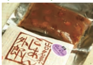
山口県山口市湯田温泉1-11-29 TEL083-922-1164 1個160円(税込み)

“ういろう”にラムレーズンの組み合わせを発見。手作りのため個数に限りがあるとのこと。一つ一つ手ごろな大きさと上品な包装も魅力的。銀紙を開くとラムレーズンの香りが匂いたち“ういろう”と水羊羹の間のようなみずみずしい食感がやみつきになりそう。夏みかん味(135円)も人気のようだ。お店は詩人中原中也記念館のすぐそば。