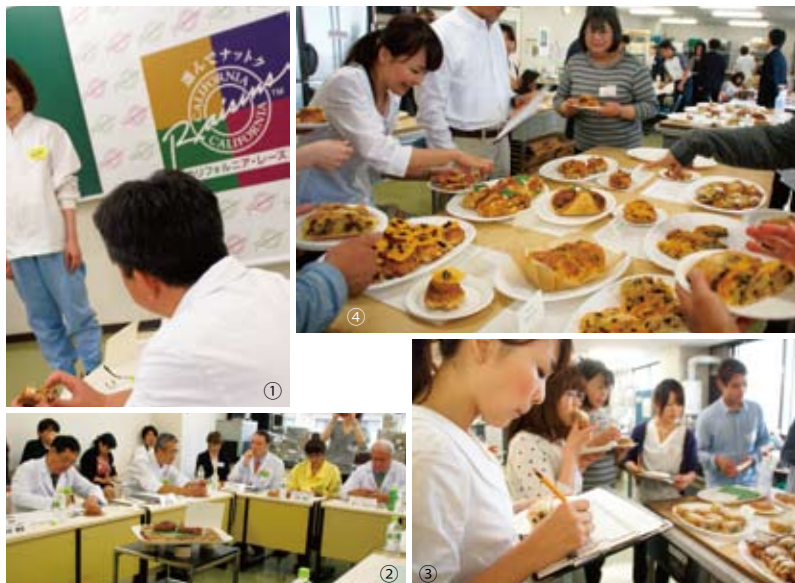
(①/②) プロ審査員からは、作業性と価格とのバランスや作品紹介の言葉使いまで、厳しい質問がファイナリストに向けられました。