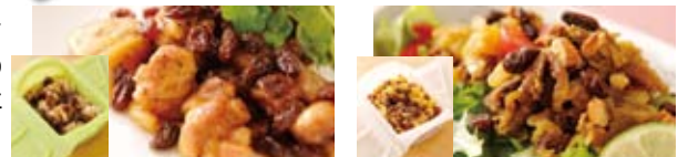
チキンのカリフォルニア・レーズン テリヤキ風