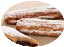
ホールセール・コンビニエンス製品部門 カリフォルニア・レーズン大賞 アマンド・レザン 三木康弘氏(神戸屋)

何年も挑戦し続けてきましたが書類選考も通らず、今回このような素晴らしい賞をもらい本当に嬉しいです。先輩達から大きな刺激をうけました。