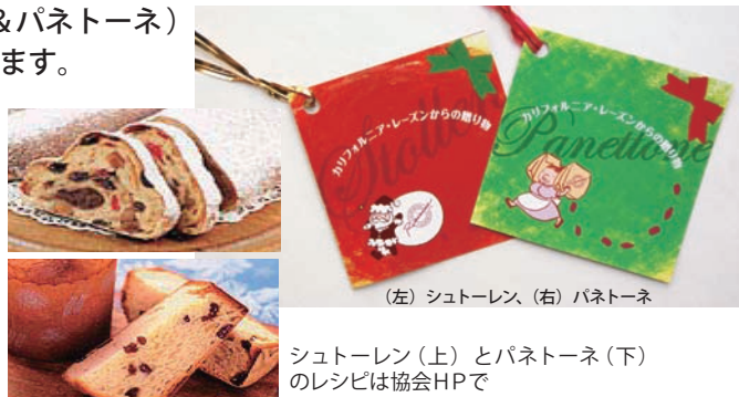
(左)シュトーレン、(右)パネトーネ

※ニュースレターアンケートでも受付けています。ぜひご利用ください。 【仕様】65mm×65mm、4ページ、4色刷り、1梱包あたり100部