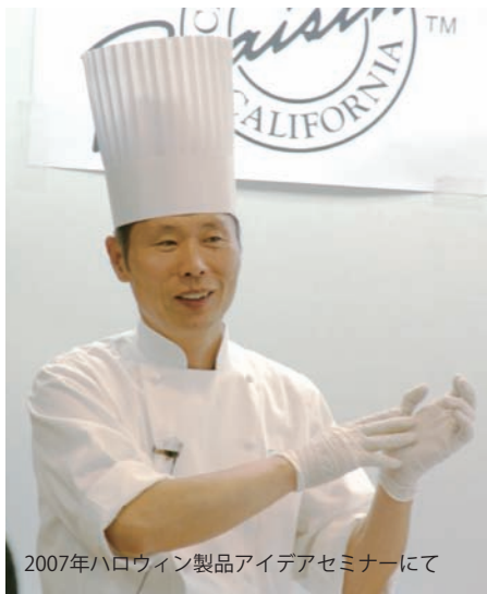
2007年ハロウィン製品アイデアセミナーにて